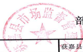
部门（单位）项目支出自评汇总表