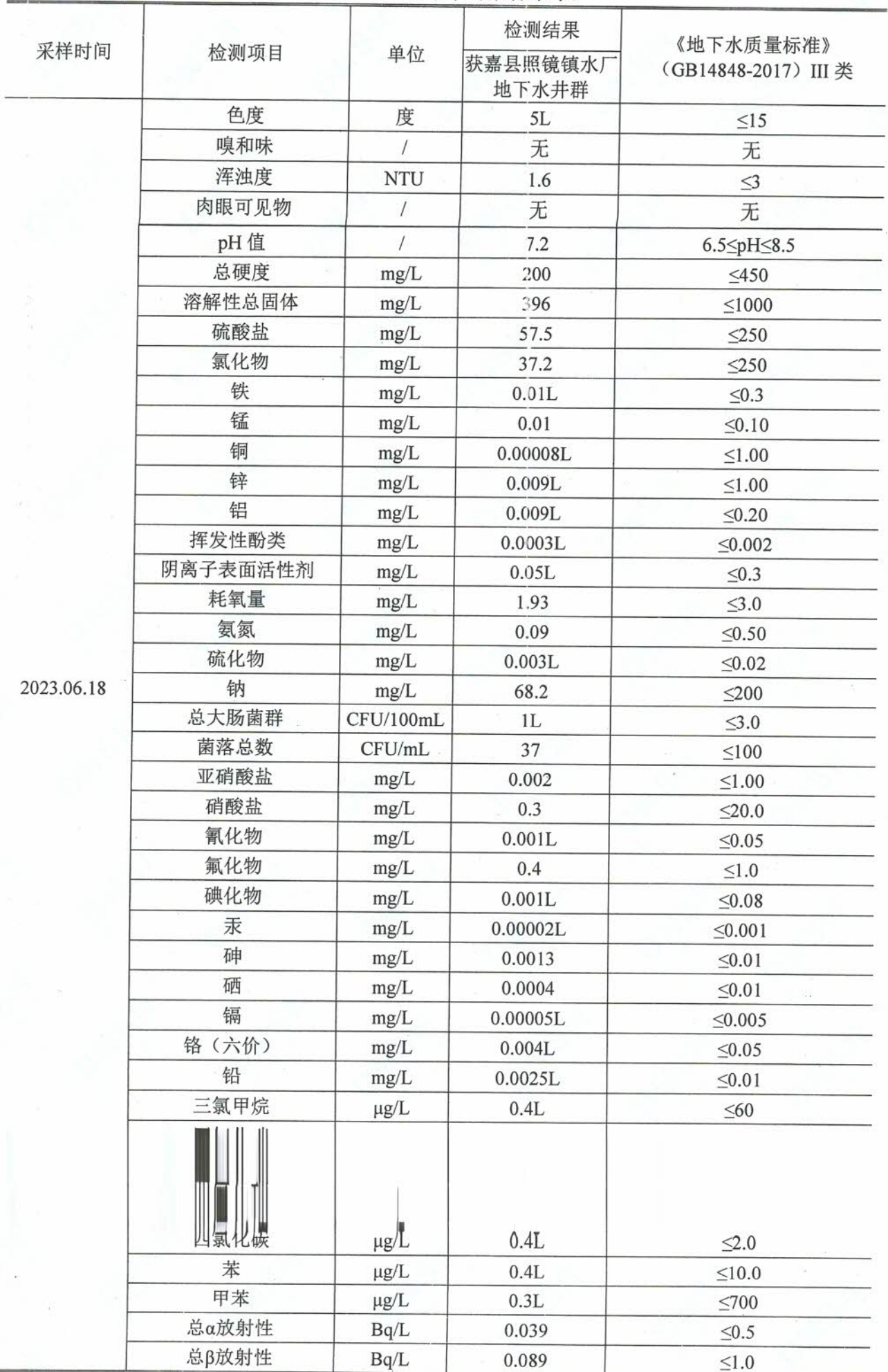
地下水检测结果表